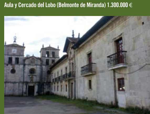
Monasterio de Cornellana (Salas) 4.500.000 €