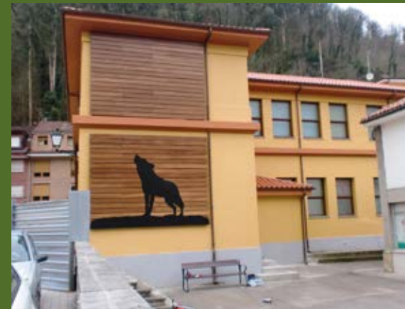
Aula y Cercado del Lobo (Belmonte de Miranda) 1.300.000 €