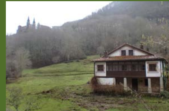
Finca "Les Llanes" (Cangas de Onís) 3.000.000 €