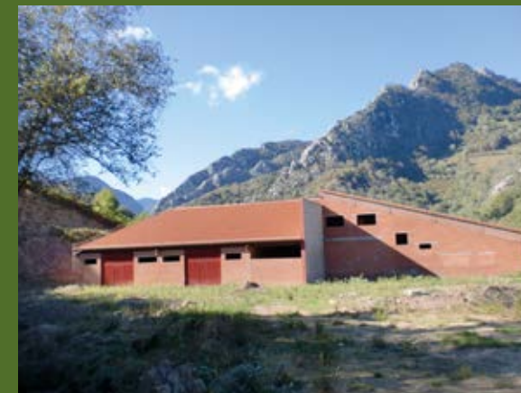
Centro de Empresas (Amieva) 2.000.000 €