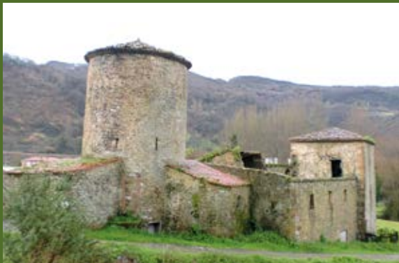
Palacio y Torre de Olloniego (Oviedo) 4.500.000 €