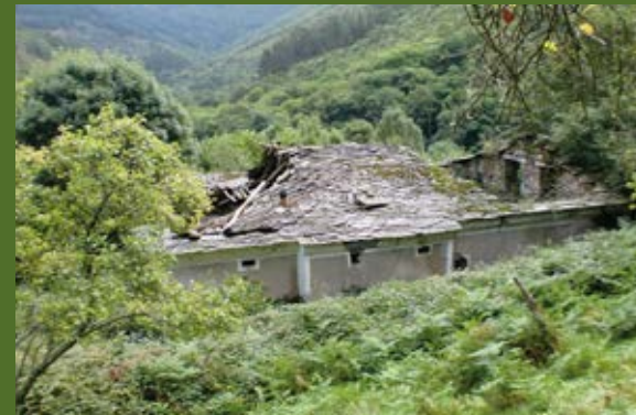
Finca "A Cabanada" (Castropol) 1.200.000 €