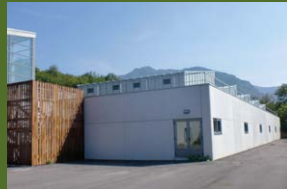
Hospital de la Fauna (Sobrescobio) 5.300.000 €