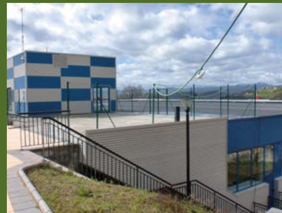
Piscinas de Tineo (Tineo) 6.000.000 €