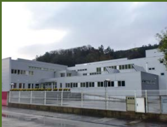
Escuela de Hostelería de Olloniego (Oviedo) 4.500.000 €