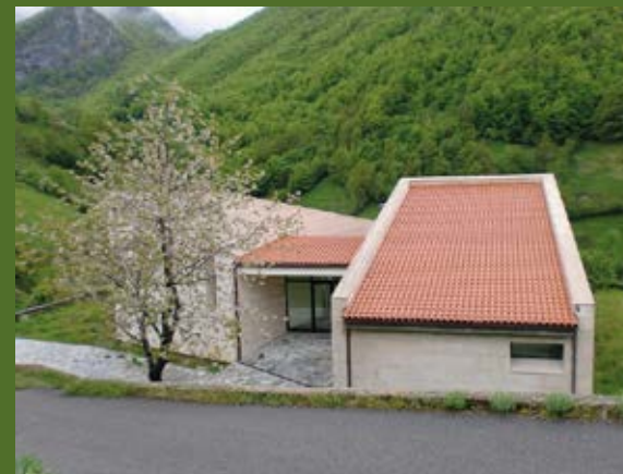
Casa del Urogallo (Tarna - Caso) 678.000 €