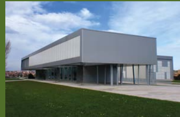
Centro Tecnológico, Campus Universitario (Gijón) 3.000.000 €