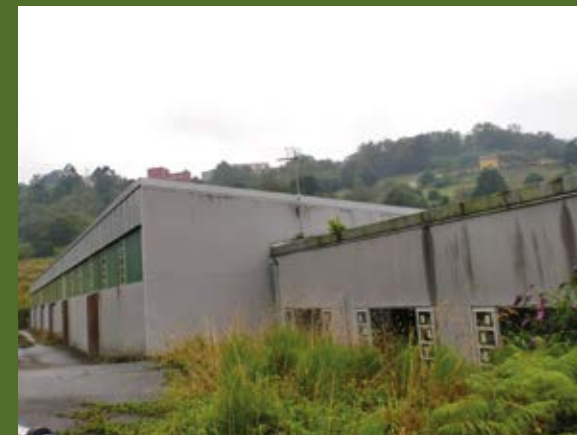
Centro Tecnológico de la Madera. Carbayín Bajo (Siero) 2.000.000 €