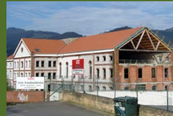
Centro "La Azucarera" de Pravia (Pravia) 4.542.000 €

MILES DE KILÓMETROS INAUGURADOS CIENTOS DE MILLONES GASTADOS DECENAS DE SENDAS ABANDONADAS